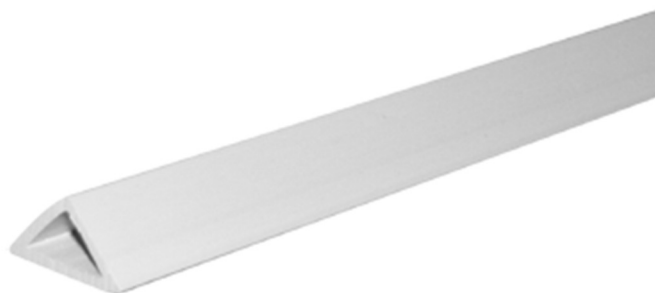
Figure 1 : Vue 3D